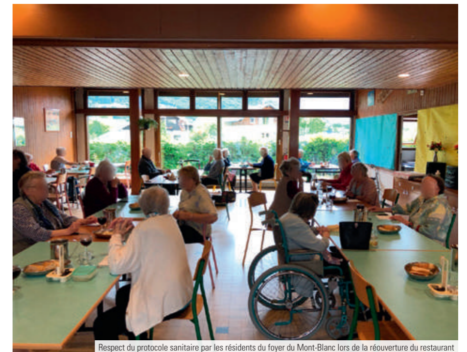
Respect du protocole sanitaire par les résidents du foyer du Mont-Blanc lors de la réouverture du restaurant

L'épicerie sociale, contrainte de fermer ses portes en raison de problèmes d'approvisionnement, voit son service essentiel évoluer en