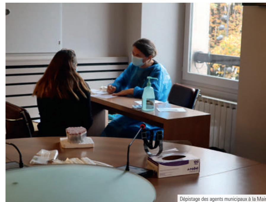
Dépistage des agents municipaux à la Mairie

Au mois de décembre, Sallanches apporte également son soutien dans la mise en place de la campagne de dépistage organisée par la Région afin de prévenir l'apparition de foyers épidémiques pendant les fêtes de Noël.